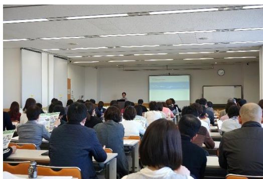
2017年度に総会と同日開催した西部地区研修会の様子です。当日は総会出席に合わせて東・中部からも沢山の参加者がありました。

特集 西部地区研修会 西部地区研修会は、任期2年の世話人が、それぞれ特色ある研修会を企画運営し、多くの方に参加いただいたりしております。今年度は米子市社会福祉協議会会員の皆さんにお世話になっているところですので、今年度第2回西部地区研修会は、3月14日(土)の総会との同日開催を予定しています。全会員に共通するテーマとして認定社会福祉士制度をとりあげ、「今さら聞けない!?」「認定社会福祉士って何?」と題し、西部地区所属の各領域の認定社会福祉士に登場いただきます。当日は機構や県士会の最新の取り組み状況の他、体験談を交えて認定制度の実際についてお話しいただく予定です。興味のある方、そうでない方も、この機会に認定制度に一度触れてみてはいかがでしょうか。皆さんの参加をお待ちしております。 西部地区研修会は地区会員にとっても身近な研修会として、これからの知識向上と親睦に貢献していきたいと思っております。引き続きご協力の程よろしくお願いたします。 次回は『中部つながろう会』を特集します。